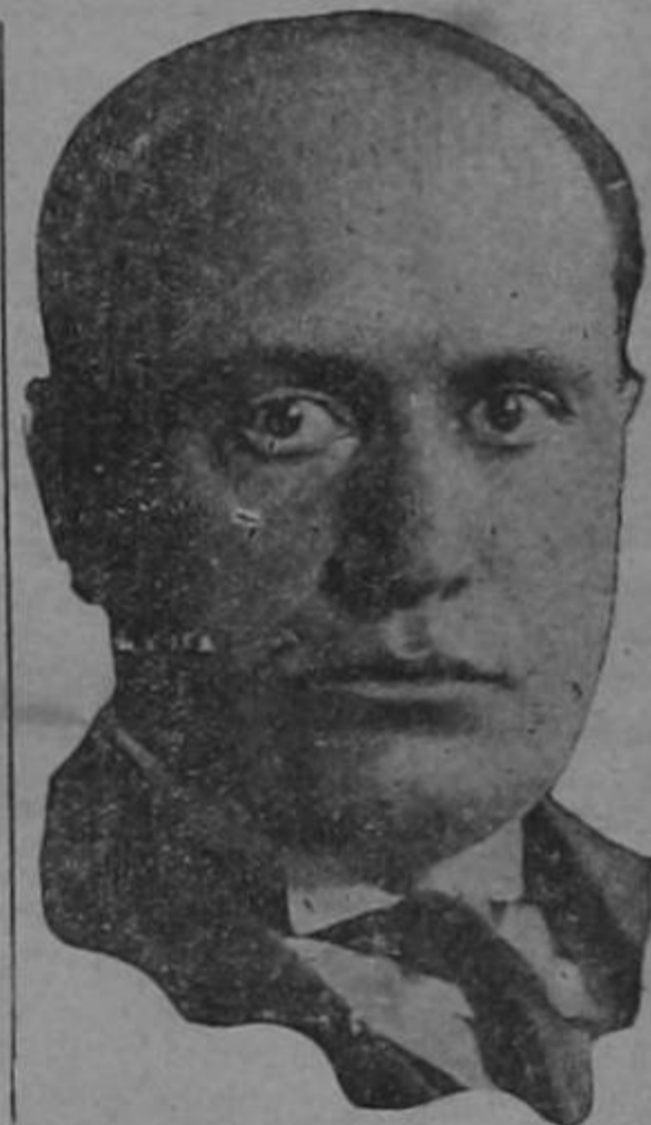
Benito Mussolini, quien confronta una difícil situación ante los acontecimientos políticos de Austria.