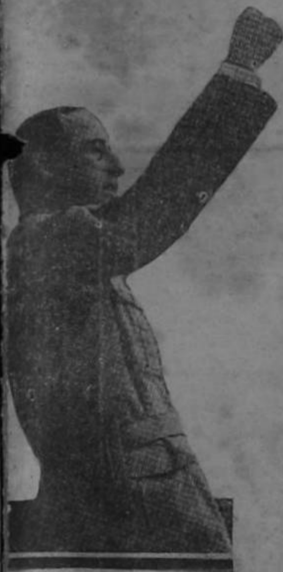
Príncipe Von Starhemberg, Vicecanciller austriaco destituido el jueves último.

GINEBRA, 14. — Rumórase en esta ciudad, que el príncipe Starhemberg, estaba preparando un golpe de estado, para imponer en Austria, una dictadura fascista, con el objeto de afianzar la influencia del gobierno de Mussolini, de quien es amigo íntimo.