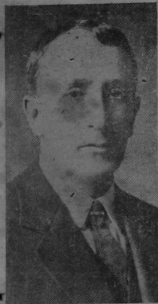
General Jorge Ubico, Presidente de Guatemala,

GINEBRA, 15. — Ha causado gran revuelo la notificación cablegráfica hecha por el gobierno de Guatemala, para retirarse de la Liga de las Naciones, actitud que se interpreta en los círculos políticos de la Liga, motivada por la influencia del gobierno italiano en Guatemala. Además teme-se que los gobiernos de Méjico, Chile y Colombia sigan el mismo camino.