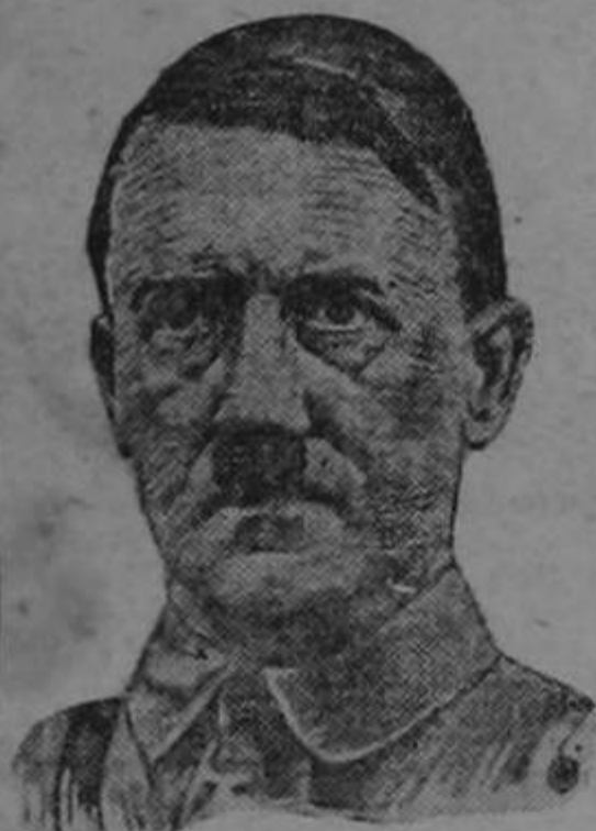
Hitler, quien creese que tendrá gran influencia en Austria, después de los sucesos políticos ocurridos en Austria.