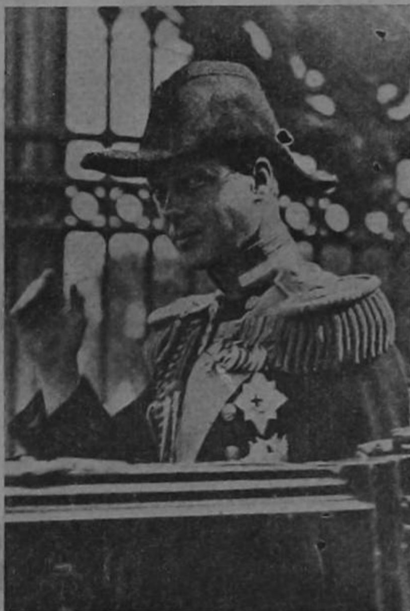
Eduardo VIII Rey de Inglaterra, sigue los sucesos políticos de Europa a cuyo gobierno se atribuye la responsabilidad de los acontecimientos políticos de Austria.

GINEBRA, 14. —La espectación general es enorme ante la difícil situación de la Europa Central, con motivo de los sucesos ocurridos en Austria y se considera que de ser definitiva la influencia alemana en Austria, posiblemente resulte la unión austroalemana, lo cual coloca a Italia en serio peligro.